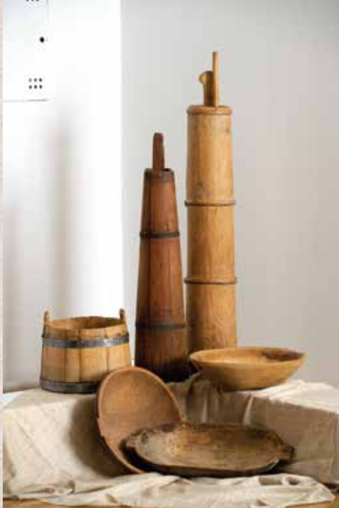
Первое помещение (справа)

Сельское население в основном занималось охотой и в основном охотилось на крупную дичь, которая наносила ущерб скоту и домашним хозяйствам в целом. Для охоты на дичь, кроме винтовки, использовались различные типы ловушек, олеза и капканы. В витрине № 1 выставлены охотничьи средства: охотничье ружье и различные ловушки из кованого железа, которые использовались для поимки дичи: медведей, волков, лис, кроликов. Пчеловодство было одной из самых важных дополнительных отраслей, и в деревне почти не было дома в котором бы не было хотя бы несколько ульев. Мед использовался как лекарство, из меда делали медовуху (тип алкогольного напитка), а из воска свечи, которые горели несколько дней в домах и церквах. В витрине № 2 выставлен улей из прутьев, покрытый грязью по всей поверхности. Рыболовство развивалось с древних времен в районе современной Черногории, как в Скадарском озере, так и в реках и на побережье. В районе Скадарского озера оно всегда было