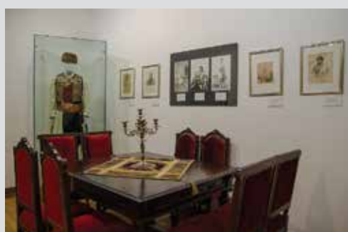
Soba VII - Senat

Njegoš je uveo obavezu o poreskim klasama i donio prvu državnu kasu u Crnu Goru 1836. iz Mletaka. Može se vidjeti slika Augusta Orou-a iz 1839. godine Njegoš na prevoju Krstacsu pripadnicima perjanika i gvardije. Dolaskom na vlast, Njegoš je osim ukidanja guvernadurstva, organizovao Gvardiju (vojno-policijski odred), Perjanike (mala jedinica gardista, tj. tjelohranitelja) i Senat. Tu je i Protokol o razrničenju sa Austrijom, potpisan je 15. jula 1841. godine i Ugovor o miru sa Turskom, potpisan sa Ali pašom Rizvanbegovićem od 12 / 24 jula 1842. u Dubrovniku. Kao nagradu za ragrničenje, Njegoš je odlikovan ruskim ordenom sv. Ane I reda.