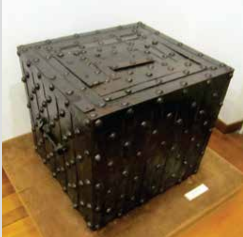
Soba VI – soba državnosti

Guvernadurstvo je postojalo u Crnoj Gori od 1717. do 1830. godine, ukinuto je na Skupštini glavara. Protjerivanjem guvernadura Vukolaja Radonjića prestaje guvernadursko zvanje u Crnoj Gori, a arhimandrit Petar Petrović postao je i formalno svjetovni gospodar Crne Gore. Zatvor u Cetinjskom manastiru bio je nazvan Guvernadurica po posljednjem guvernaduru koji je bio tu zatočen.