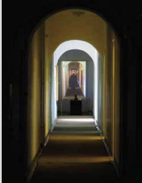
Sobe IX, X, XI

Njegoš je planirao da iskuje novac i za to pripremio sav potreban alat, koji je kasnije pronađen u Cetinjskom manastiru, a nacrt novca je sam uradio. Trebalo je da bude nazvan Perun, po slovenskom bogu groma. U ovoj sobi se nalazi otisak novca u vosku. Tu je i prvo izdanje Luče mirkokozma, Njegoševog filozofsko-religioznog spjeva. Za nastanak ovog maestralnog djela nije bilo potrebno odlaziti na neka tamna, skrovita mjesta, gdje bi uz sjaj lojanica, pretočio svoje vizije u besmrtne stihove. Bio je dovoljan pejzaž i miris mističnog ambijenta njegovog kamenog zdanja. U neraskidivoj vezi sa mikrokosmosom je i teleskop, Plezlov rad, proizveden u Austriji 1835. godine. Slike na zidovima ove sobe, i naredne tri, rad su crnogorskog akademskog slikara Pera Počeka (1878- 1963), koji je za školovanje odabrao blizinu italijanske kraljice Jelene, kćerke kralja Nikole. Ciklus Gorski vijenac čini 38 slika, a njihove nazive odredio je sam autor.